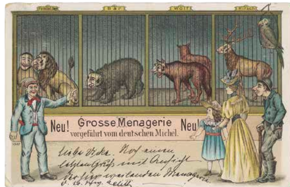
„Grosse Menagerie“ (versandt 1899); Tiere bevölkerten zahlreiche judenfeindliche Postkarten. Sie spielten meistens auf jüdische Familiennamen an, wie etwa Hirsch, Löwy oder Bär.

Die Ausstellung verfolgt jedoch nicht nur das Ziel, etwas Vergangenes zu präsentieren. Vielmehr will sie Besucherinnen und Besucher über Motive und Bildsprachen aufklären, damit sie lernen, sowohl Antisemitismus als auch andere Formen diskriminierender Etikettierungen in der Gegenwart zu erkennen und zu deuten; denn nur wenn man in der Lage ist, Codes zu dechiffrieren und Symbole zu erschließen, kann man sich dagegen wehren. Wer die Ausstellung besucht hat, wird die im privaten, halböffentlichen und öffentlichen Raum geführten Diskurse z. B. über „die“ Ausländer oder „den“ Islam reflektierter wahrnehmen können.